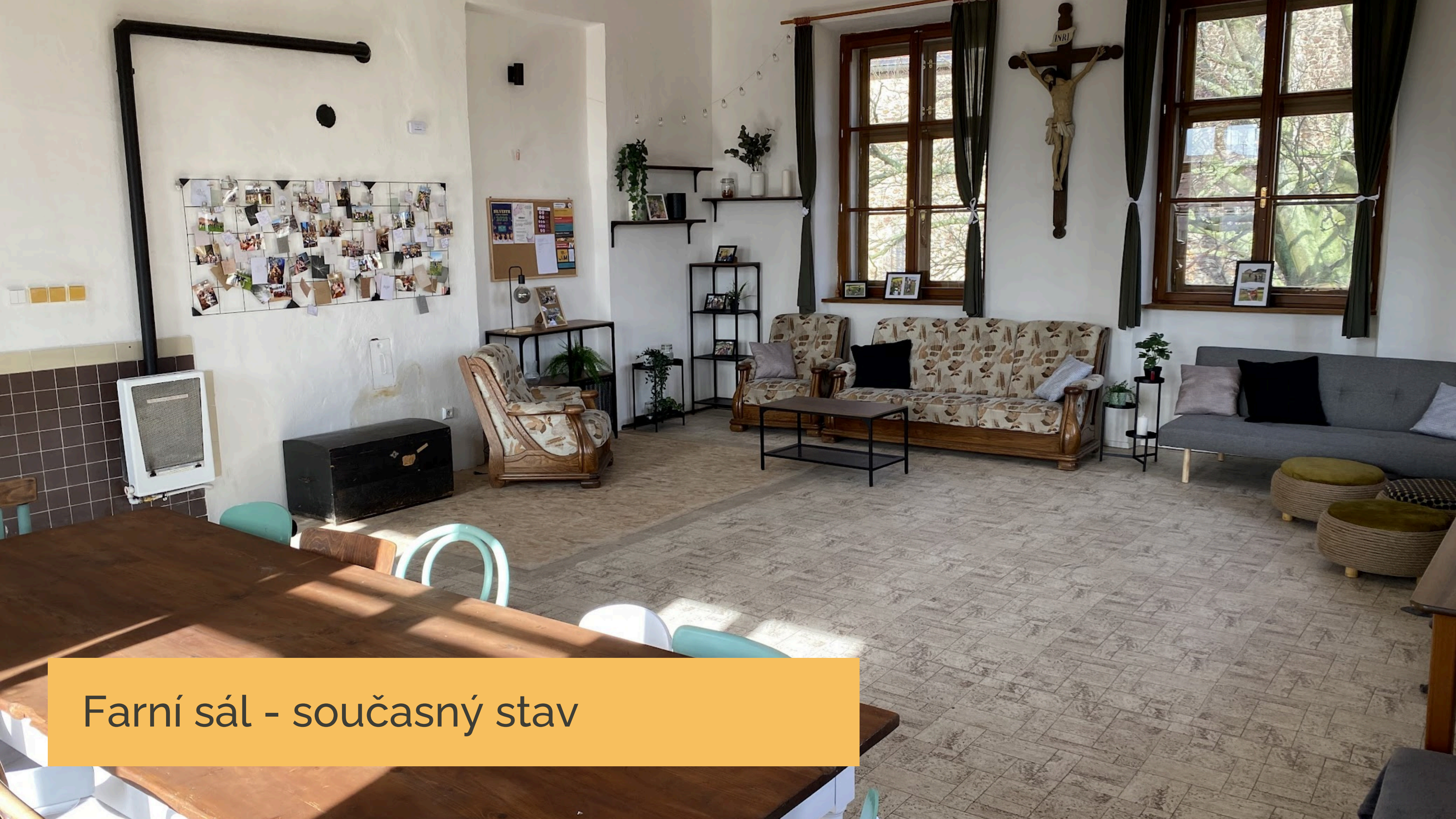
Farní sál - současný stav